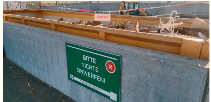
Bitte keine Abfälle in Container einwerfen, die mit einer Kette gesperrt und mit einem „Bitte nichts einwerfen“-Schild gekennzeichnet sind.

Wir bitten Sie, bei der Schrankenanlage des WSZ einzeln einzufahren und Ihre elektronische Berechtigungskarte zu verwenden. Bitte geben Sie die Berechtigungskarte nicht anderen Personen. Beim Öffnen des Schrankens mit der elektronischen Berechtigungskarte wird jede Einfahrt aufgezeichnet. Kommt es zu Fehlwürfen, werden diese dem registrierten Kartenbesitzer in Rechnung gestellt!