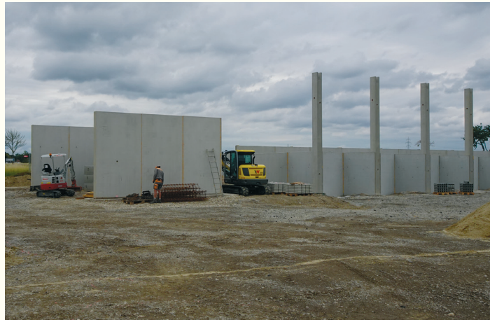
Die Bauarbeiten am Wertstoffzentrum 2 Groß-Enzersdorf schreiten voran. Im Bild der Platz für die Grünschnittlagerfläche und die künftige Wertstoffsorthalle.

Mit der Errichtung und dem Betrieb dieses WSZ setzt der G.V.U. Bezirk Gänserndorf den Strategiewechsel in Hinblick auf die Sammelzentren fort. Statt der gemeindeeigenen Altstoffsammelzentren sollen langfristig rund 13 regionale, gemeindeübergreifende Wertstoffzentren eine effiziente und nachhaltige Ressourcenwirtschaft sicherstellen. Das erste Regionale Wertstoffzentrum in Reyersdorf ist seit Herbst 2023 in Betrieb.